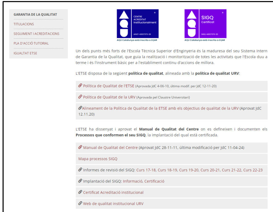
Figura 1. Plana web principal de Qualitat de l'ETSE – gener 2025