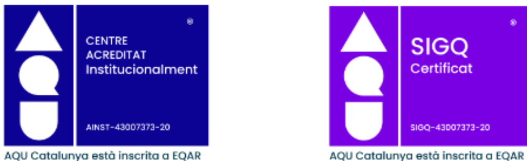
Figura 1. Segells oficials AQU (acreditació del centre i implantació del SIGQ)

El Sistema Intern de Garantia de la Qualitat (SIGQ) de l'ETSE està compost per un conjunt de processos que descriuen de forma detallada tant el procediment a seguir per a dur a terme les diferents activitats de l'Escola com els indicadors que cal mesurar per assegurar el seu funcionament correcte. La seva definició actual és fruit d'un llarg procés de maduració, que va començar al curs 2009-10. L'any 2010, en el marc del programa AUDIT d'AQU Catalunya, l'ETSE va obtenir la valoració positiva del disseny inicial del SIGQ. La Política de Qualitat de l'ETSE, que inclou un conjunt d'objectius estratègics, es va aprovar per primer cop per Junta de Centre al juny de 2010. Des de llavors s'han anat realitzant revisions progressives del SIGQ, adaptant-lo al model institucional de la URV, en constant evolució i millora. Actualment el SIGQ de l'ETSE és una eina ja madura, integrada plenament en el funcionament diari de l'Escola, i els seus processos descriuen de forma efectiva les accions a realitzar i les evidències a recollir associades a totes les tasques necessàries per assolir els objectius del Centre. Aquesta maduresa en la implantació i funcionament del SIGQ va portar al curs 19-20 a una certificació positiva per part d'AQU de la implantació del SIGQ i a l'obtenció de l' acreditació institucional de l'ETSE per part del Consejo de Universidades (resolució oficial del 17 de setembre de 2020). Els segells corresponents es mostren a la figura 1.