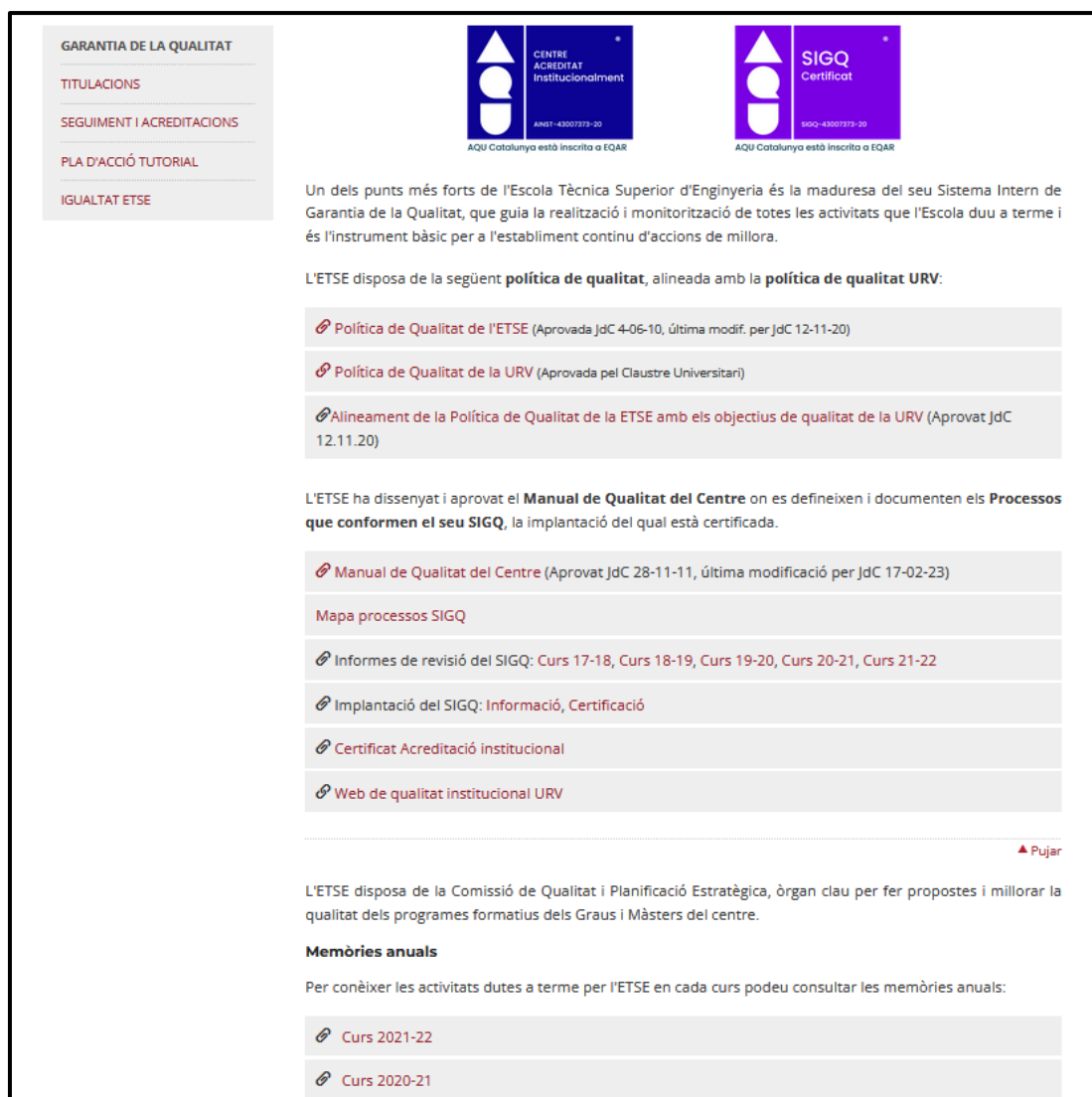
Figura 1. Plana web principal de Qualitat de l'ETSE – gener 2024